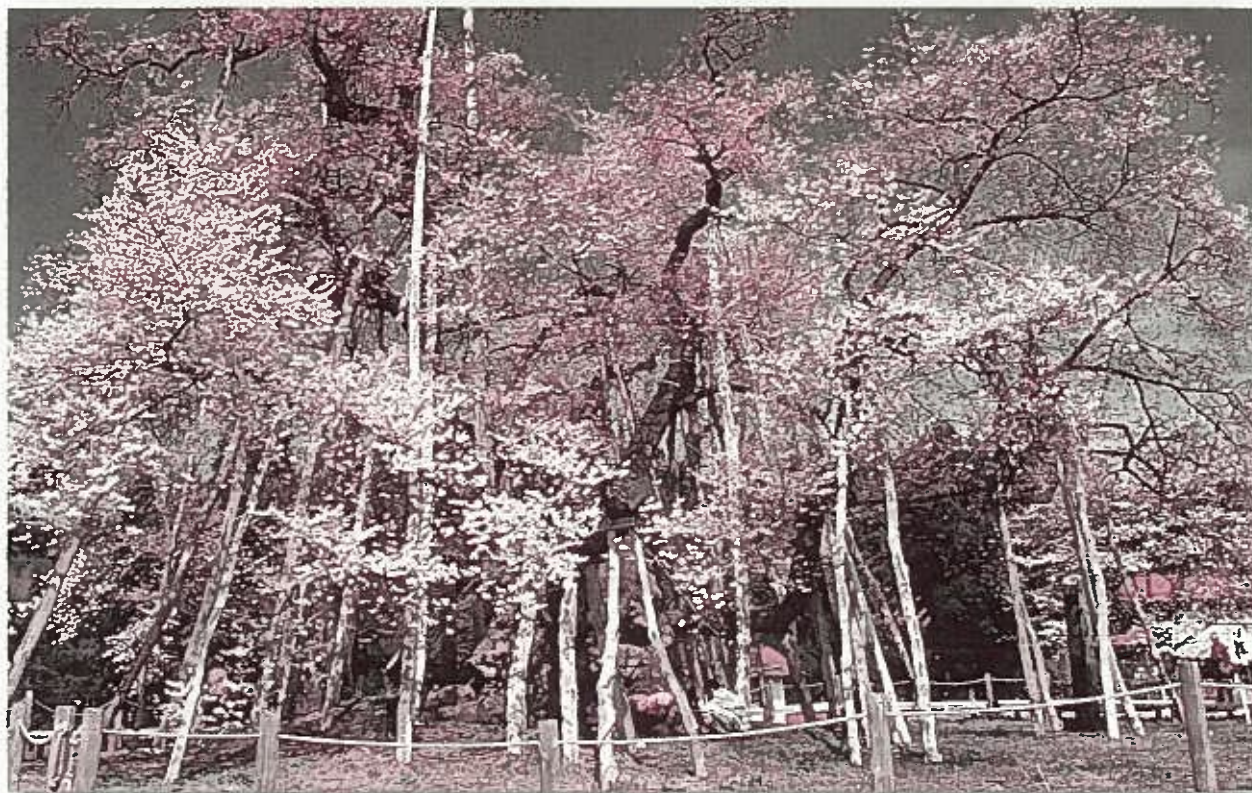
長井市 桜回廊 伊佐沢久保桜