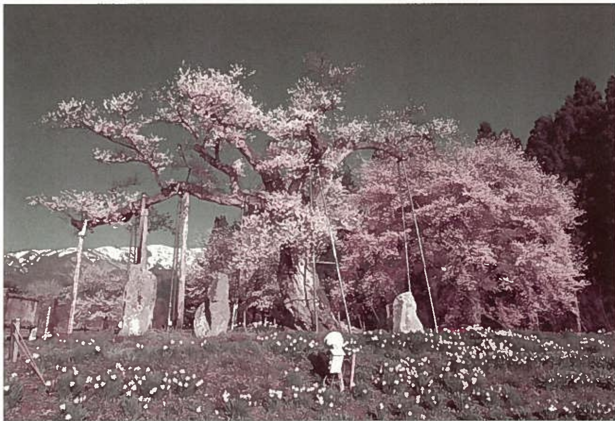
白鷹町 釜ノ越サクラ