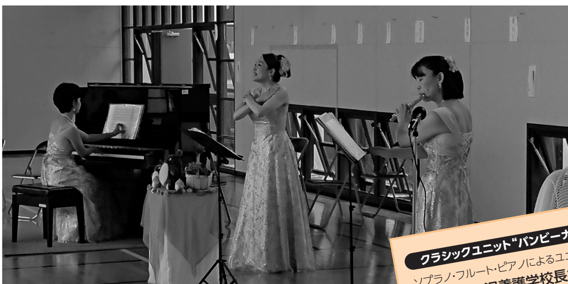
クラシックユニット“パンビーナ”

令和3年度の実施校の募集については、2月上旬に所属所長あてに通知しますので、ぜひお申込みいただき、課外授業、創立記念事業、地域住民の方々との交流事業等でご活用ください。