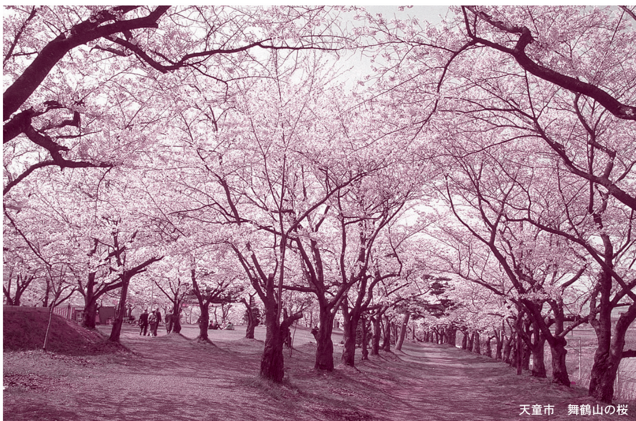
天童市 舞鶴山の桜