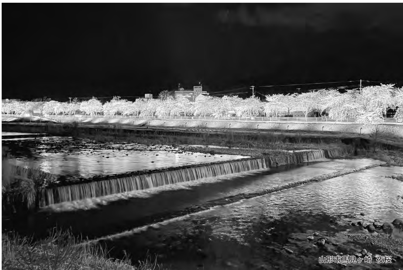
山形市馬見ヶ崎 夜桜