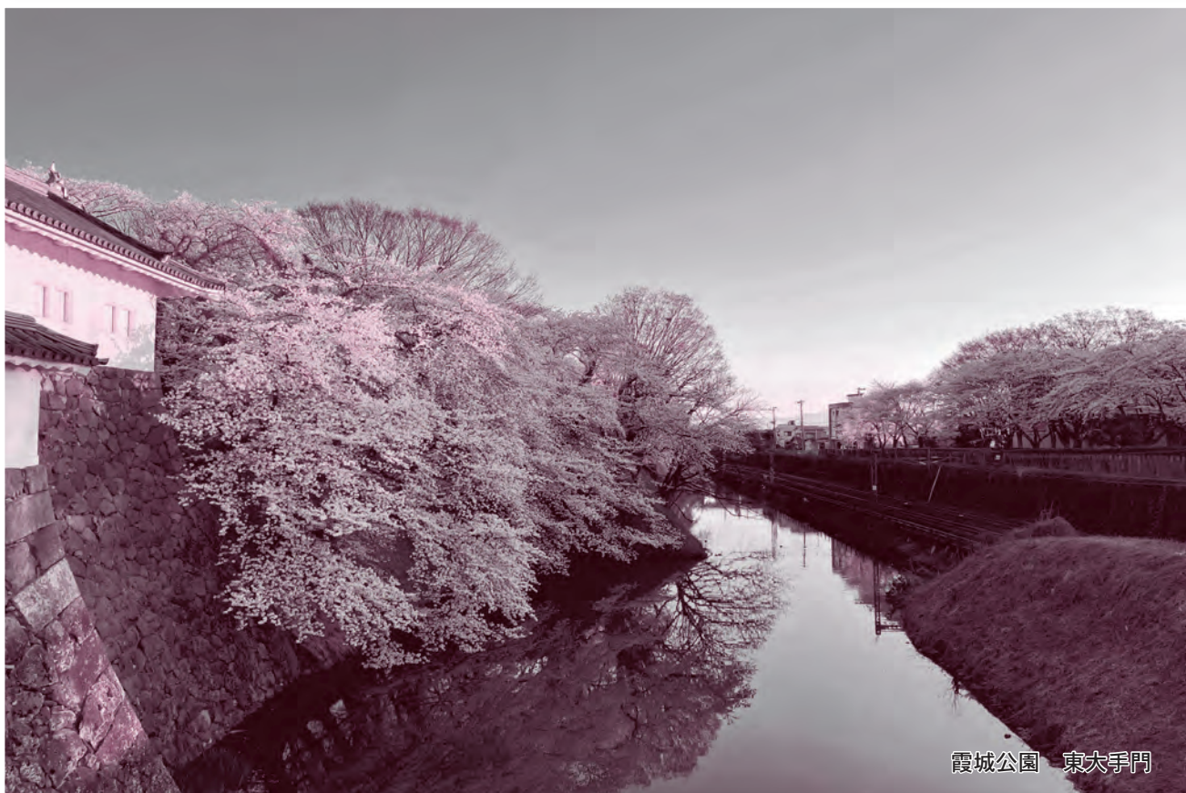
霞城公園 東大手門